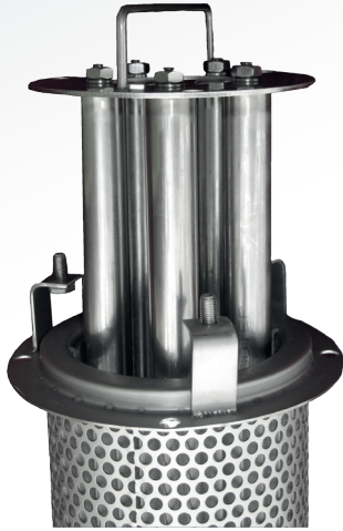
Dispositif magnétique inséré dans un panier adapté